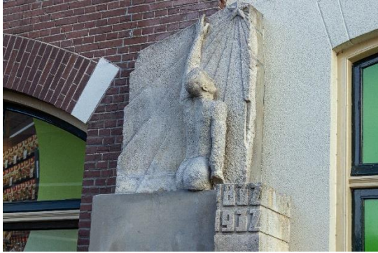
Beeld klimmende naakte man

In 1932 werd het 100-jarig bestaan van het bedrijf gevierd dat in 1929 was omgezet in de NV Bakhuis Vleeswaren- en Conservenfabrieken Olba. Ter gelegenheid hiervan vervaardigde een Haagse beeldhouwer een beeld van een klimmende naakte man. Het beeld werd in 2011 herplaatst bij het voormalige hoofdkantoor van het bedrijf aan de Aaldert Geertestraat.